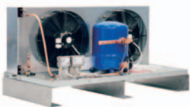
Lågbyggt kylsystem som är servicevänligt.