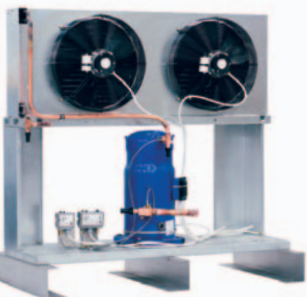
Övermonterat kylsystem som ger dig mer plats i mjölkrummet.