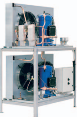
Fristående kylsystem med stativ.